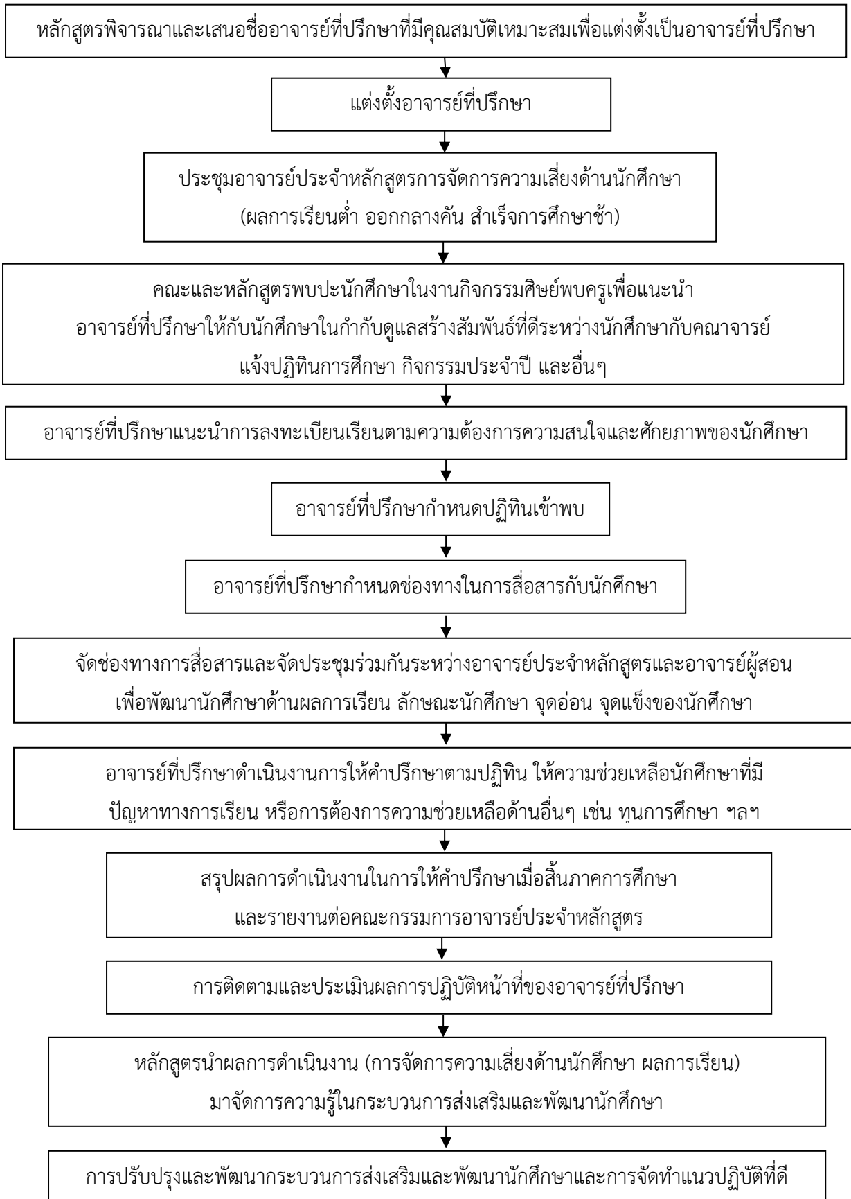
แผนภูมิที่ 2 แสดงกระบวนการควบคุมดูแล การให้คำปรึกษาวิชาการและแนะแนวแก่นักศึกษา